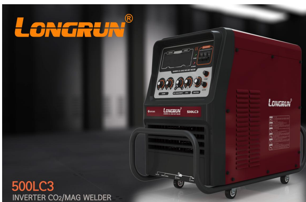
500LC3 INVERTER CO 2 /MAG WELDER